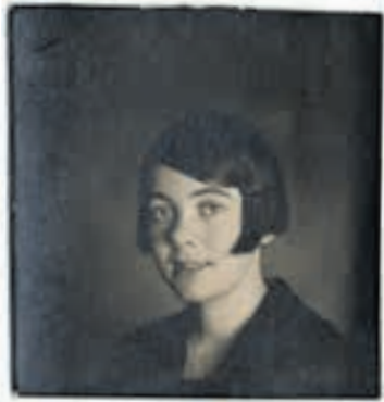
Karin Boye